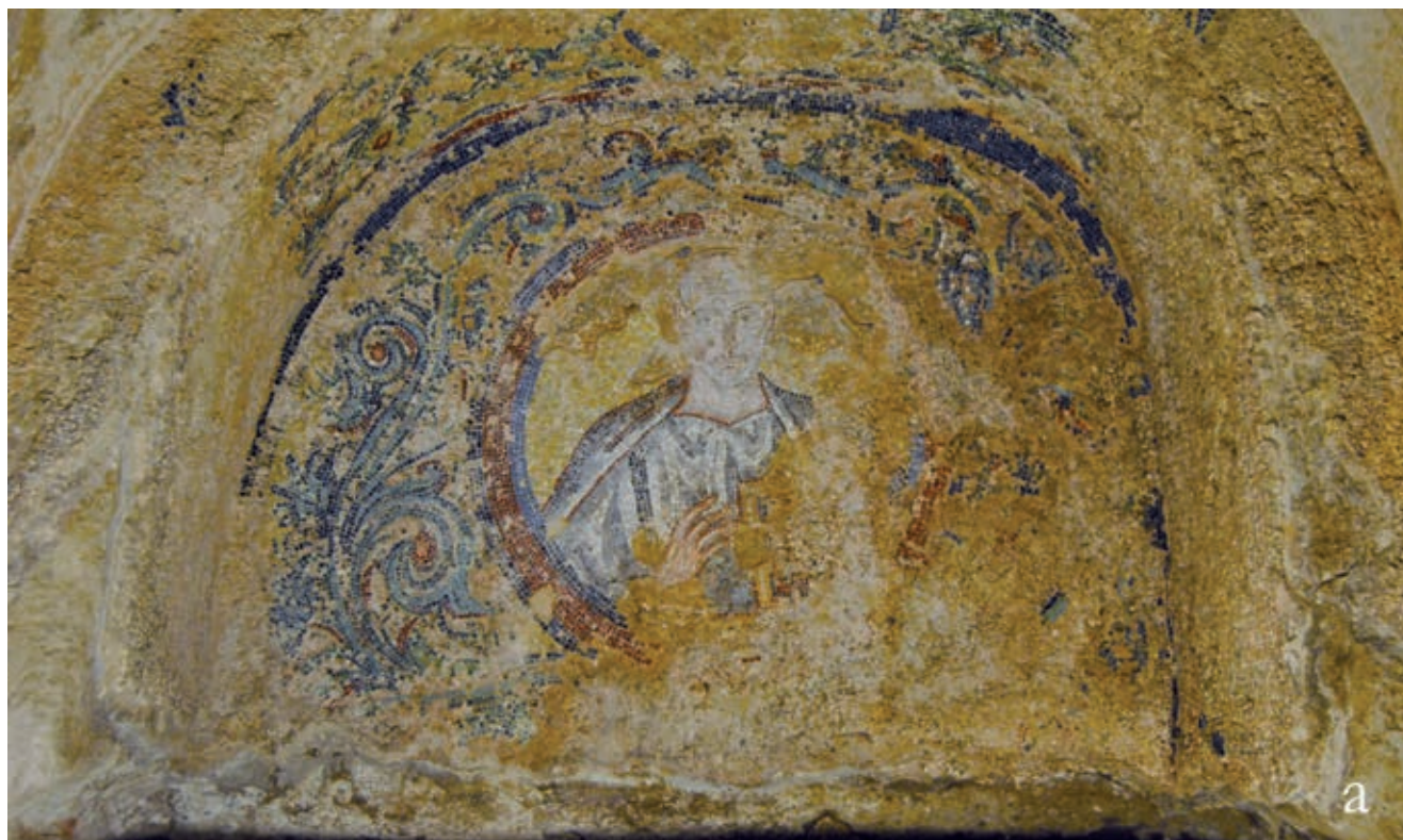
Fig. 5. Cripta dei Vescovi (A6), ritratti musivi dei vescovi Giovanni I (a) e Quodvultdeus (b)