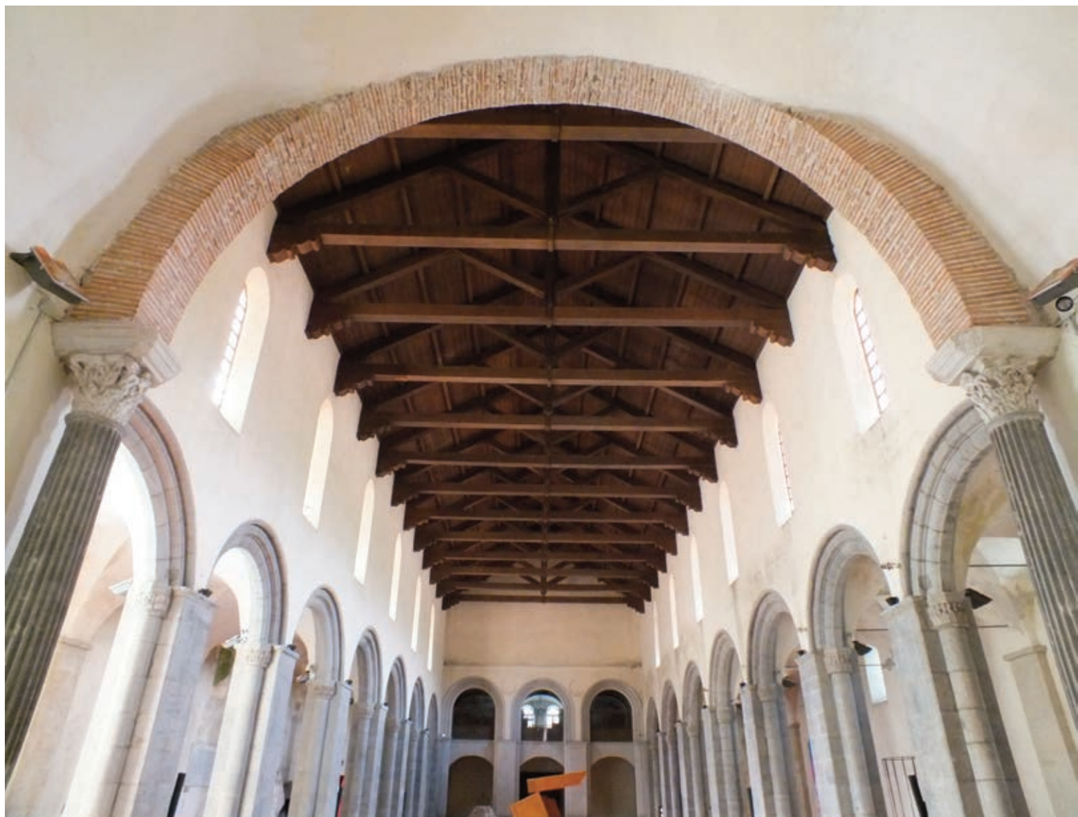
Fig. 6. L'interno della Basilica subdiaconale di San Gennaro extra moenia visto dal presbiterio

un'aula di culto a pianta rettangolare con altare ubicato in corrispondenza della sottostante tomba di San Gennaro (B6). Sulla volta della chiesa ipogea fu dipinto il catalogo figurato dei primi quattordici presuli partenopei: Aspreno, Epithimitus , Marone, Probo, Paolo I, Agrippino, Eustazio, Efebo, Fortunato, Massimo, Zosimo, Severo, Urso e Giovanni I 27 (fig. 4). Per la costruzione della Basilica dei Vescovi furono distrutte le preesistenti camere funerarie, nonché la volta del sottostante cubicolo B6 che aveva accolto i resti di San Gennaro 28 . Al fine di creare una struttura adatta a reggere l'impiantito ligneo della chiesa, nella adiacente galleria B8 del livello inferiore furono costruiti degli archi in muratura 29 . Nel corso degli interventi di riassetto del complesso, i due accessi al cubicolo B6 vennero chiusi; la tamponatura dell'ingresso occidentale fu decorata con un affresco che ritrae il martire tra