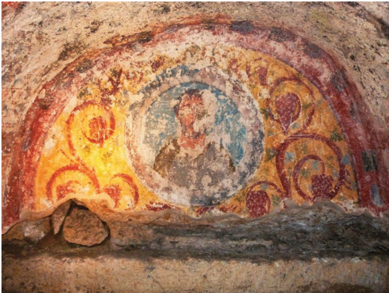
Fig. 10. Busto clipeato di Heleusinius in un arcosolio della galleria A41

Anche per questo la Catacomba di San Gennaro si differenzia significativamente dai cimiteri di Roma, dove – dopo i primi decenni del V secolo – l'utilizzo sepolcrale continuò in maniera estremamente sporadica solo nelle cripte venerate o negli spazi immediatamente circostanti, perlopiù con sepolcri privilegiati ad sanctos 44 . A Napoli, invece, il complesso ianuario visse, nel corso del VI secolo, il momento più alto, in quanto alla frequentazione e alla creazione di nuovi spazi funerari, tra cui un significativo numero di sepolture privilegiate 45 . I vescovi partenopei continuarono ad essere deposti fino alla seconda metà del IX secolo nella Catacomba di Capodimonte, dove trovò sepoltura anche il duca Stefano III († 832), come attesta l'epitaffio che, nella seconda metà del Cinquecento, era conservato nella Basilica di San Gennaro extra moenia , nella quale in precedenza era collocato anche il carme sepolcrale del console Cesario († 788), figlio del vescovo e duca Stefano II 46 . Altri duchi napoletani, come indicano le epigrafi, furono invece inumati in chiese urbane: è il caso di Teodoro tumulato nel 730-731 nella diaconia dei Santi Giovanni e