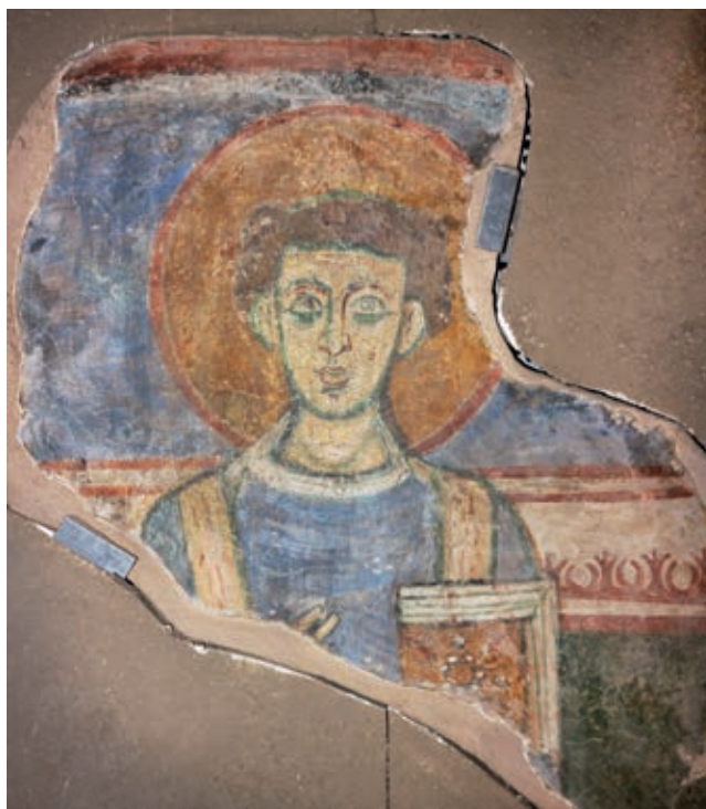
Fig. 13. Affresco staccato raffigurante San Gennaro, già collocato nel cubicolo B5

Significative testimonianze materiali riconducibili a inumazioni di età moderna, ma ovviamente senza alcun collegamento con fenomeni pestilenziali, sono riemerse nel corso degli scavi condotti in catacomba dal 1977 al 1992. Mi riferisco, in primo luogo, ad un piccolo crocifisso, forse di bronzo, trovato il 31 marzo 1977 nella tomba a fossa 1 nel cubicolo A49 (fig. 1), al livello superiore della catacomba; Ciavolino assegnò il manufatto, al momento purtroppo non reperibile nei depositi del complesso ianuario, ad un'epoca imprecisata («parrebbe del 1600») 87 . Un secondo reperto, forse quello più interessante, proviene anch'esso dal livello superiore: si tratta di due trecce di capelli scoperte l'8 aprile 1992 sul fondo della tomba a fossa 4, situata ad est dell'edicola della Croce 88 (figg. 1, 12), insieme a frammenti di tessuto e re-