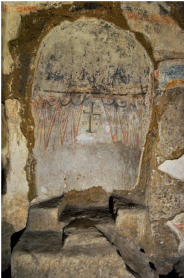
Fig. 12. Edicola della Croce (A68), nicchia absidata con i resti della decorazione dipinta

Alla frequentazione della catacomba da parte dei monaci vanno ricondotte molto probabilmente anche alcune pitture del vestibolo superiore, della Basilica dei Vescovi e della basilichetta di Sant'Agrippino, sulla cui datazione la critica è però in disaccordo. È il caso, innanzitutto, del Cristo in mandorla tra angeli e santi raffigurato nel lucernario del vestibolo superiore; datato in passato all'VIII 58 , al IX 59 o al X-XI secolo 60 , il dipinto è stato di recente assegnato al primo quarto dell'XI secolo 61 . Anche i due pannelli con coppie di santi dipinti sulla parete di fondo della Basilica dei Vescovi, cui si giungeva dopo aver attraversato il vestibolo superiore e la galleria A2, non trovano d'accordo gli studiosi, in merito alla datazione. Pesantemente rovinate dal fumo delle candele e dai graffiti tracciati dai visitatori nel corso dell'età moderna e contemporanea, le pitture furono staccate dalla parete nel 1973 e posate su un supporto, per poi essere di nuovo ricollocate in situ , dove – dopo alterne vicende – sono ora di nuovo sistemate 62 . A seguito del restauro, che evidenziò le prime due lettere del nome del martire (IAnuarius) raffigurato nel pannello di sinistra insieme ad un santo monaco (fig. 14), Fasola assegnò i dipinti all'epoca del vescovo Atanasio I 63 , sulla scorta della te-