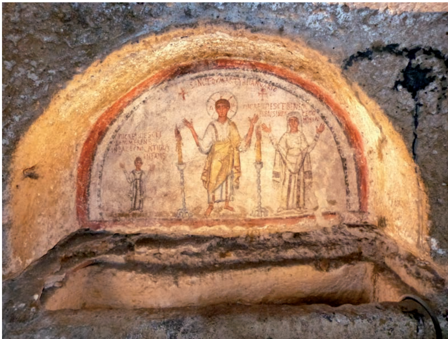
Fig. 8. Le defunte Cominia e Nicatiola ai lati di San Gennaro nel cubicolo A43

tutti i segni della ricchezza e di una volitiva celebrazione di famiglie abbienti 36 .