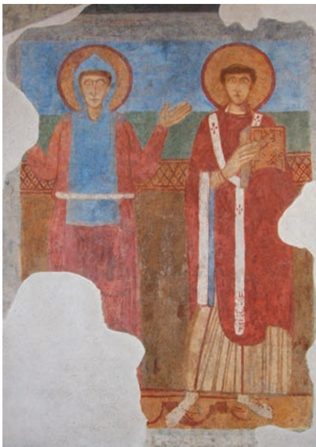
Fig. 14. Affresco staccato con San Gennaro e santo monaco , di nuovo in situ nella Basilica dei Vescovi (A69)

una sezione, realizzate dall'incisore Carmine Perriello su disegno dell'architetto Arcangelo Guglielmelli 93 . Da allora la catacomba suscitò la curiosità di eruditi napoletani e stranieri, segnando una nuova tappa della vita del complesso che divenne ben presto meta dei viaggiatori del Grand Tour .