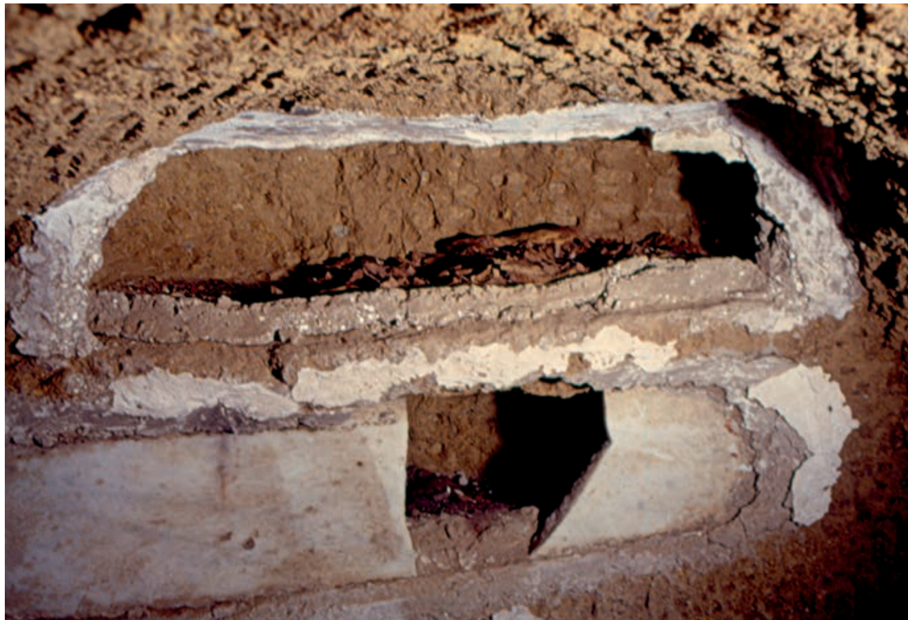
Fig. 11. Arcosolio e loculi nell'“ipogeo del bambino” nella galleria A2 (da C. Ebanista, A. Rivellino, in Atti 2021c, fig. 25)

Alla presenza del cenobio va attribuita, con buona probabilità, l'esecuzione della decorazione pittorica della cosiddetta edicola della Croce (A68), la nicchia absidata ricavata nel piedritto nord dell'arco centrale del triforium situato sul lato orientale del livello superiore della catacomba 52 (fig. 12). Nell'estradosso dell'arco, sui piedritti e nella nicchia si riconoscono due strati pittorici sovrapposti. Quello più antico, su fondo bianco, presenta una larga fascia intorno alla nicchia e una cornice in rosso e nero nell'intradosso, dove delimita il campo centrale, in cui un sinuoso tralcio vitineo rosso con grossi grappoli racchiude un pannello rettangolare con il volto di Cristo; l'immagine è rivolta in direzione del visitatore proveniente da est, ossia dalla galleria A29 sul cui fondo si apriva l'accesso orientale della catacomba. Allo strato più recente, oltre a tre pannelli sui piedritti dell'arco, appartengono la decorazione della nicchia con la croce associata alla formula I(ησού)C X(ριστό)C NIKA nel velarium e, al di sopra, due personaggi, di cui rimangono i piedi e i lembi delle vesti, e forse dei rami fioriti. Due pannelli ricorrono ai lati della nicchia, mentre il terzo sulla parete opposta in corrispondenza del piedritto orientale; in quest'ultimo pannello è raffigurato un santo benedicente con veste blu, laddove a destra della nicchia s'intravedono tre aureole, una grande a sinistra e le altre due più piccole