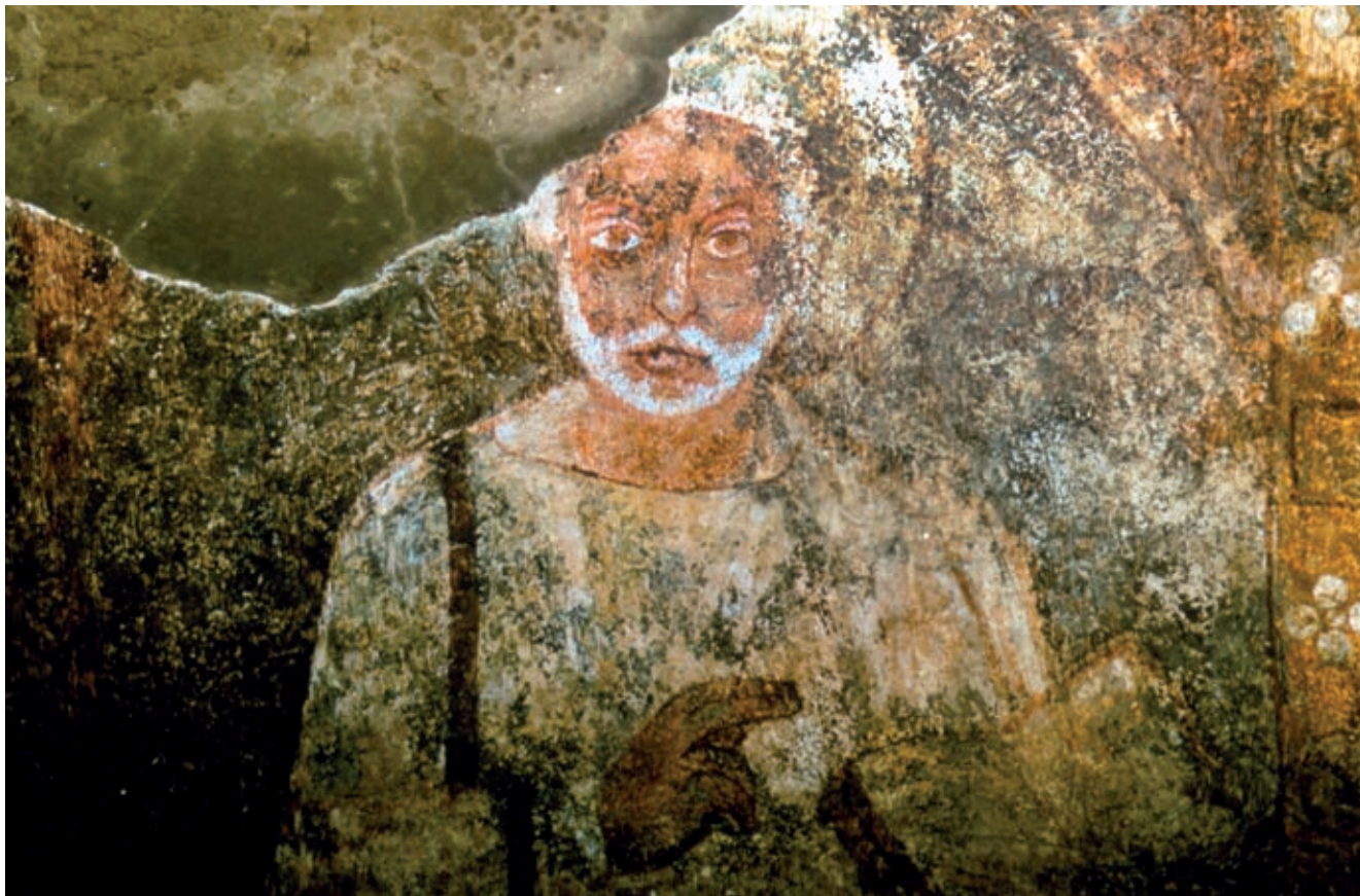
Fig. 4. Ritratto di Sant'Aspreno sulla volta della Basilica dei Vescovi (A69) al livello superiore della catacomba

e Vittore – si concentrarono nella catacomba, dove già si trovava il sepolcro di Agrippino 14 . I Gesta episcoporum Neapolitanorum attestano l'installazione di sette tombe vescovili nel complesso ianuario: la più antica – ricordata nella prima sezione della cronaca (quinto decennio del IX secolo) – è quella di Giovanni I († 432) 15 depresso presso il cubicolo ove aveva sistemato le reliquie del martire; la tomba del presule è stata scoperta da Fasola sulla parete di fondo della Cripta dei Vescovi 16 (fig. 5a). Nell'adiacente arcosolio, ricavato sulla parete nord del cubicolo, fu invece sepolto un personaggio con incarnato scuro che lo studioso ha identificato con il vescovo di Cartagine Quodvultedus morto esule a Napoli anteriormente al 25 ottobre 454 17 (fig. 5b). I ritratti musivi del presule napoletano e del collega nordafricano, inseriti come sono nell'ampio clipeo, trattenuto da densi e solenni rameggi vegetali, mostrano tutto il loro intento autocelebrativo e, dall'altro, denunciano l'insopprimibile desiderio di entrare nei particolari del ritratto, nel senso pieno del termine 18 .